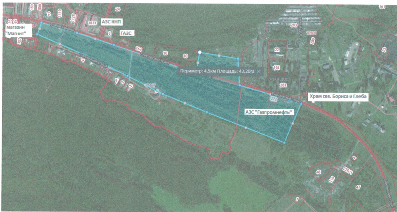
Схема границ проектирования микрорайона «Юго-Восточный» в г. Енисейске Ситуационный план М 1:2000